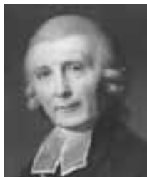
Bildnis Dr. Johann Georg Rosenmüller

Dieser bedeutende deutsche protestantische Theologe wurde am 18. Dezember 1736 in Ummerstadt geboren. Nach seinem Theologiestudium an der Universität Altdorf begann Rosenmüller 1767 seine Tätigkeit als Pfarrer in Hildburghausen. Bereits 1773 wechselte er als Professor an die Universität Erlangen, wo er auch promovierte. 1785 erfolgte seine Berufung zum Ordinarius an die Universität Leipzig sowie zum Superintendenten der berühmten Thomaskirche in Leipzig. In seiner Funktion als Kirchenreformer setzte sich Rosenmüller intensiv für die Modernisierung der evangelischen Liturgie ein. Er legte großen Wert auf einen verständlichen Religionsunterricht an den Schulen und gilt als bedeutender Umgestalter der Kirche im Geist der Aufklärung. Rosenmüller war neben seiner theologischen Lehrtätigkeit als Autor und Schriftsteller sehr produktiv. Hier nur einige seiner Bücher: - „Compendium theologiae christianae“ - „Vorlesungen über die Dogmatik“ - „Auslegung des Neuen Testaments“ - „Grundsätze der Predigtkunst“