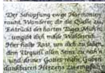
Ummerstädter Quelle am Rappersgraben

Leonhard Döhler verstarb am 22.11.1968 in seinem geliebten Ummerstadt. Sein Grabstein befindet sich heute als Einzeldenkmal auf dem Friedhof.