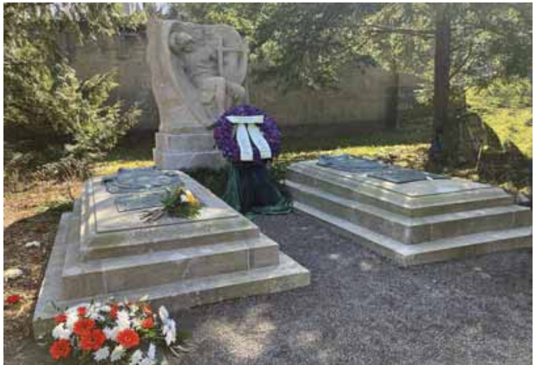
Grablege für Georg II. und die Freifrau von Heldburg auf dem Parkfriedhof in Meiningen am 200. Geburtstag des Herzogs.